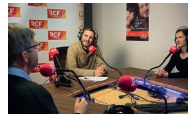
Dans les studios RCF