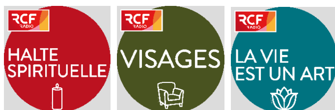
Les podcasts de l'été RCF